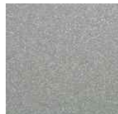
Metallic EP7008 - EW7008