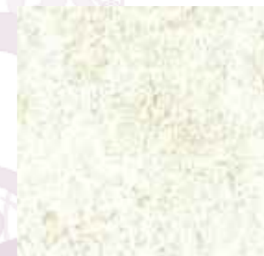
Sand EP7006 - EW7006