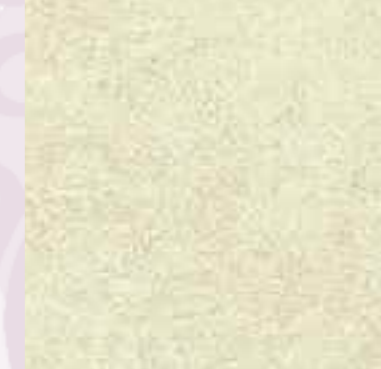
Nevada EP7010 - EW7010