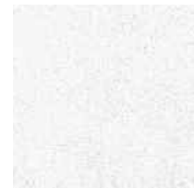
Polar Wit EP7003 - EW7003